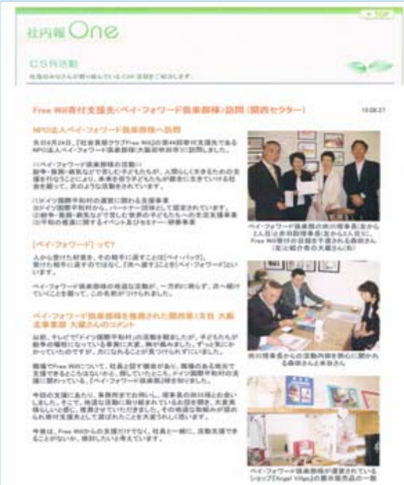
社内報にもご紹介いただきました

「Liebe愛しい天使たちへ」の発行に際しリコーテクノシステムズ株式会社様からのご寄附を頂きました。そのお礼を兼ねて、リコーテクノシステムズ様でドイツ国際平和村のDVDの上映と子どもたちの状況を紹介させていただきました。子どもたちの平和村でのビデオを真剣に見ておられ、会場は静まりかえっていました。講演は3か月のボランティア体験のある理事長が話しました。参加した皆様は深く感銘し世界の子どもたちがおかれている現状が伝わったと思います。RICOHの皆様には、私達の支援活動に興味を持って頂き、「今後のイベントやチャリティー・コンサートに家族共々参加します」との嬉しい声掛けをいただきました。当日は、リコー関西地区の役員の皆様の大切な会議でしたが、お時間を頂きましたことを、お礼申し上げます。RICOHの皆様との交流を機会に多くの企業様とも交流が持てるように努力してまいります。