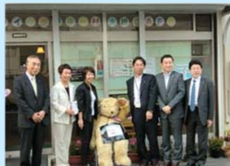
6月24日(木) Angel Villageにて、「リコー社会貢献クラブ」の「Free Will Club」さんより目録を頂きました。